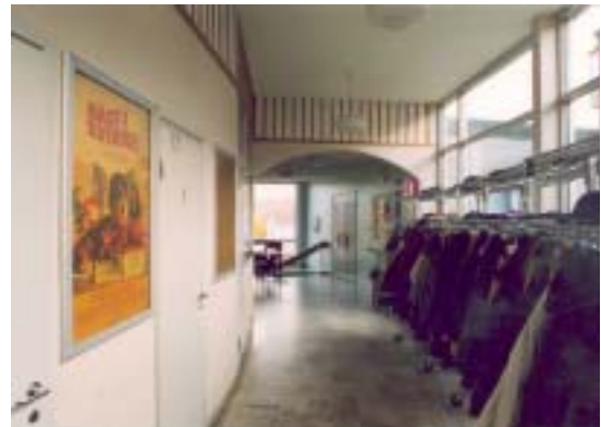
Foajén leder till biografsalong, samlingsrum och till trappan ned.