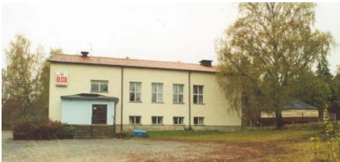
Fasad mot Ö