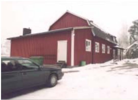
Sceningång till vänster och ny handikappsanpassad entré till höger i bild