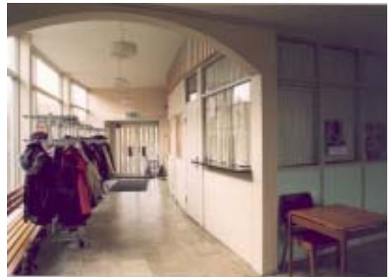
Entré rakt fram och biljettkassa till höger