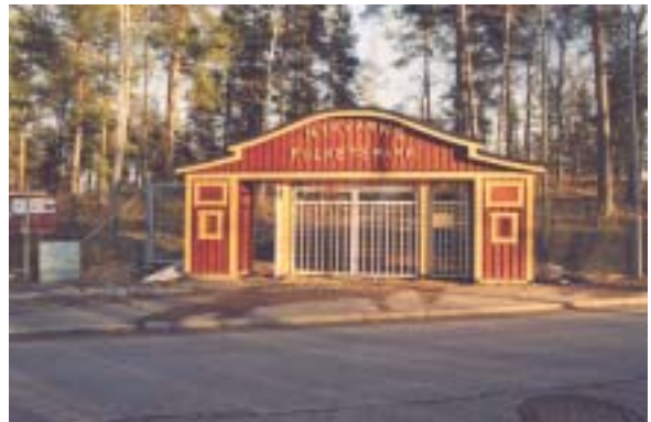
Huvudentré, fotograferad från nordväst