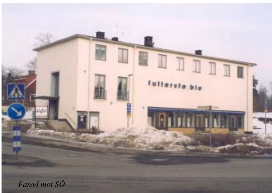
Fasad mot SÖ

Kommun: Huddinge Socken: Huddinge Objekt: Fullersta bio Besöksadress: Norrängsvägen 1 Postadress: 141 44 Huddinge Tfn: 08-711 22 16