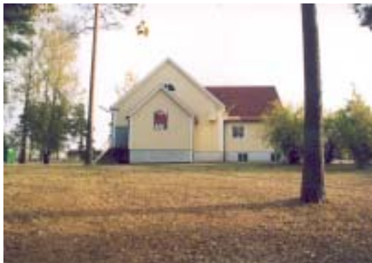
Fasad mot V