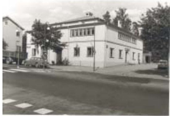
Danspalatset ligger i anslutning men ägs inte längre av FH. 1973

Föreningens första kassör stal pengar ur kassan och rymde till Amerika.