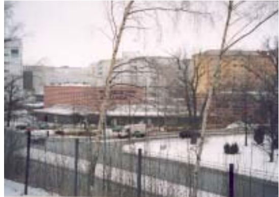
Vy från Hallunda tunnelbanestation, fasad mot SO