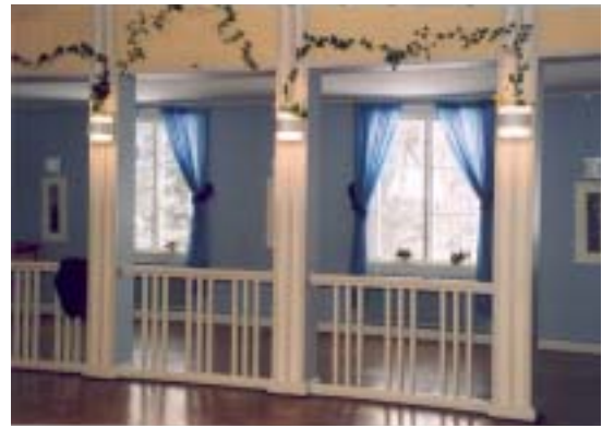
Detalj från stora salen