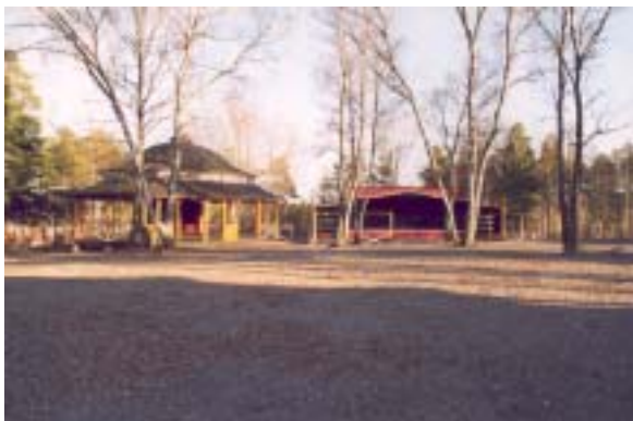
Dansbana från 1928 till vänster och scen från 1998 till höger. Fotot taget från nordväst.