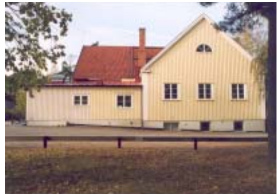
Fasad mot Ö