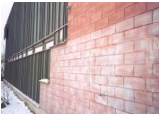
Detalj av norr fasad