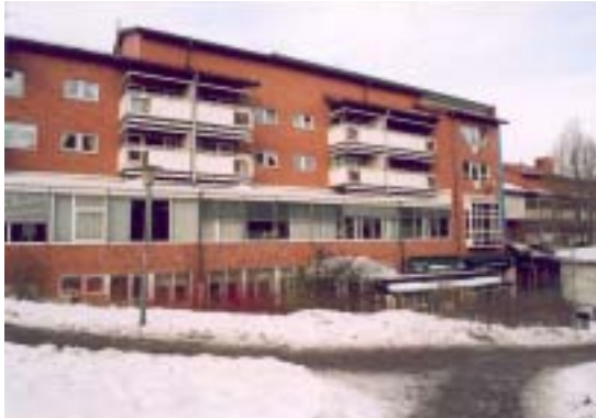
Fasad mot Ö