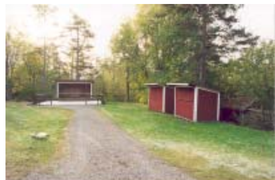
Dansbana och tombolastånd upprustades inför 80-års jubileet