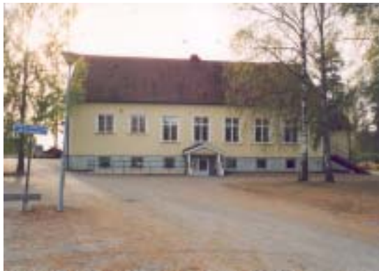
Fasad mot N

Föreningen bedrev tidigare parkverksamhet.