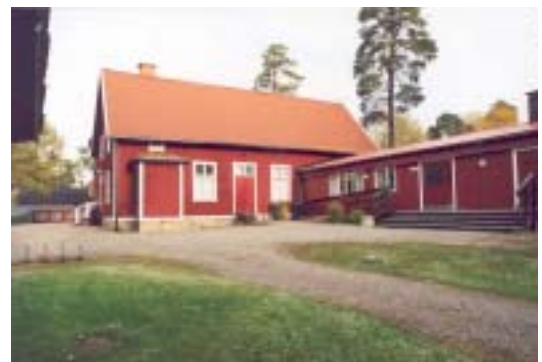
Den sammanfogade AMS längan till höger