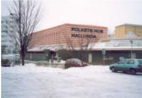
Fasad mot SO

Kallas även Kultur- och konferenshuset, Botkyrka. Har tidigare också kallats Norra Botkyrka Folkets hus.