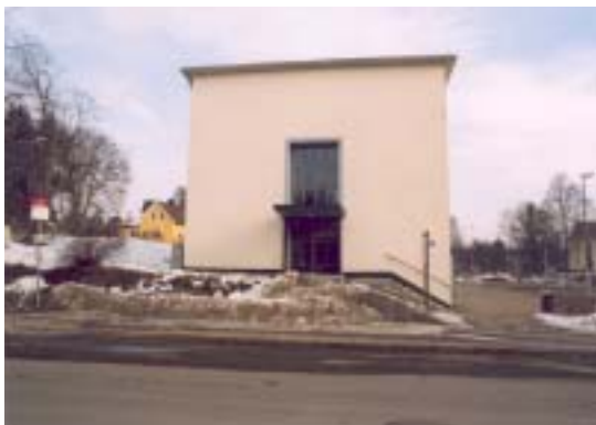
Gavelfasad mot SV. Huvudentré.