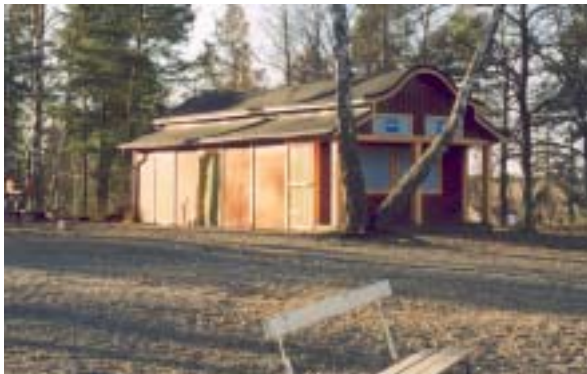
Tombolan har förlängts med två tredjedelar för att inrymma toalett och förråd. Fotograferad från sydost.

Föreningen marknadsför sig som den enda riktiga folkparken i länet.