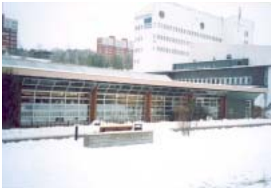
Biblioteksdelen med Riksteaterns byggnad i bakgrunden, fasad mot N