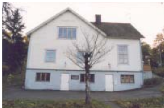
Fasad mot V

Huset uppfördes i början av 1920-talet till en kostnad av 37 000 kronor.