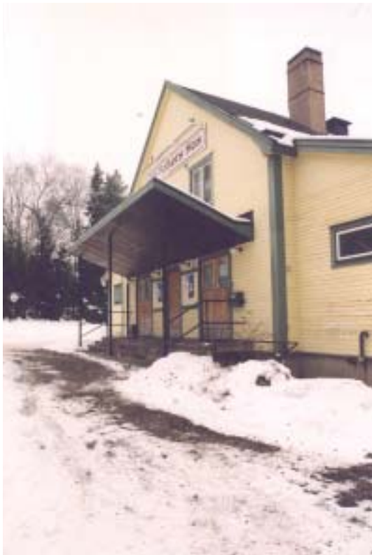
Fasad mot Ö

Fotografi i Svenska folkrörelser V visar den ursprungliga byggnaden. Det södra sidoskeppet fanns ej, detsamma gällde skärmtaket ovan entrén. Huset hade även småspröjsade fönster med vita foder och i övrigt var huset rödfärgat.